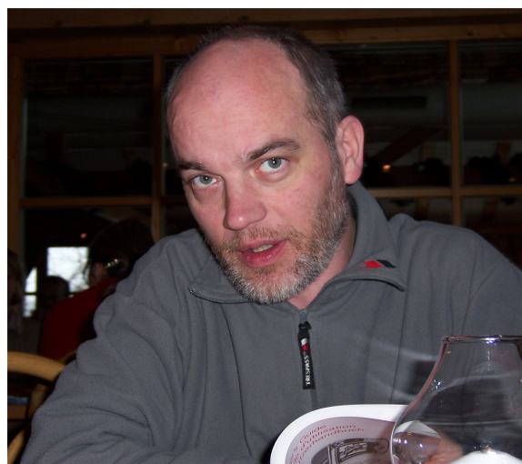
FIGURA 1: Frank Mittelbach

Qualche tempo dopo mi fu chiesto dal mio dipartimento di installare una versione commerciale di T E X sui nostri PC nuovi fiammanti e di tenere una serie di lezioni a studenti e professori su come usarlo. Questa distribuzione era provvista di L A T E X 2.08 e una copia con rilegatura mobile del manuale (che sarebbe diventato il libro di Leslie Lamport su L A T E X). L A T E X, confrontato a Plain T E X, mi sembrava molto buono ma, purtroppo,